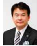
さいたま市長 清水勇人

さいたま市では、東日本各地とヒト・モノ・情報の交流をさらに増やしていく「東日本連携」の取組を進め、東日本の「いいコト」が集まるまちを目指しています。